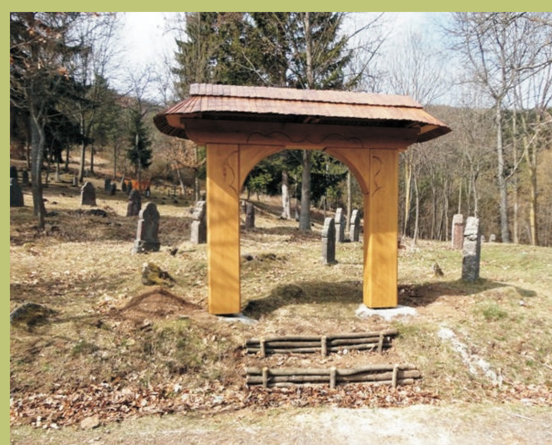
Replika drevenej vstupnej brány do cintorína