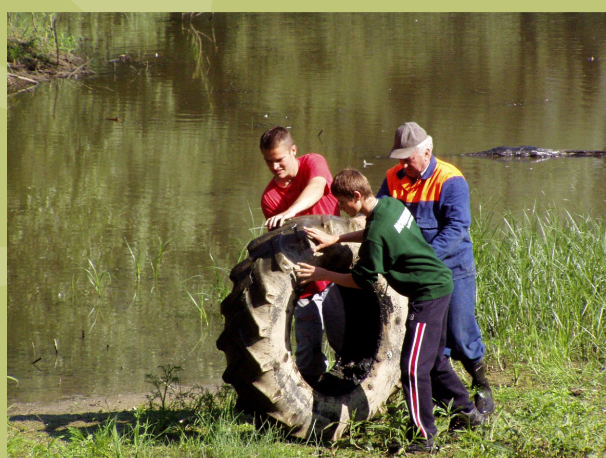
Dobrovoľníci pri čistení meandra