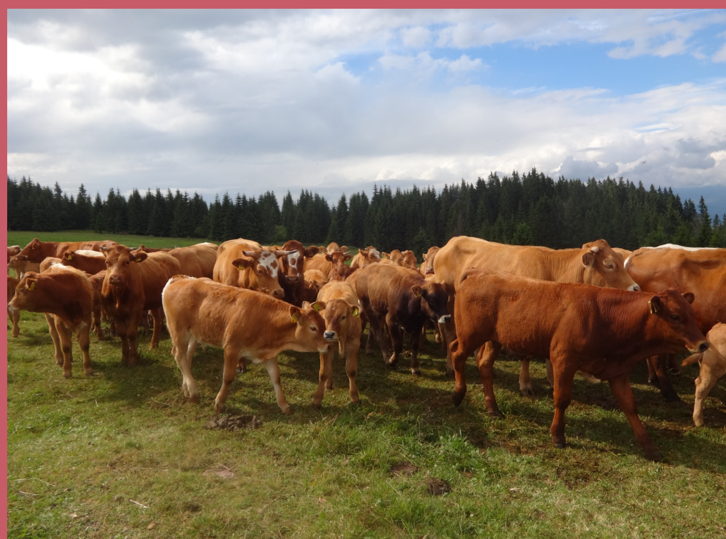
Pasúci sa dobytok v okolí Liptovskej Tepličky