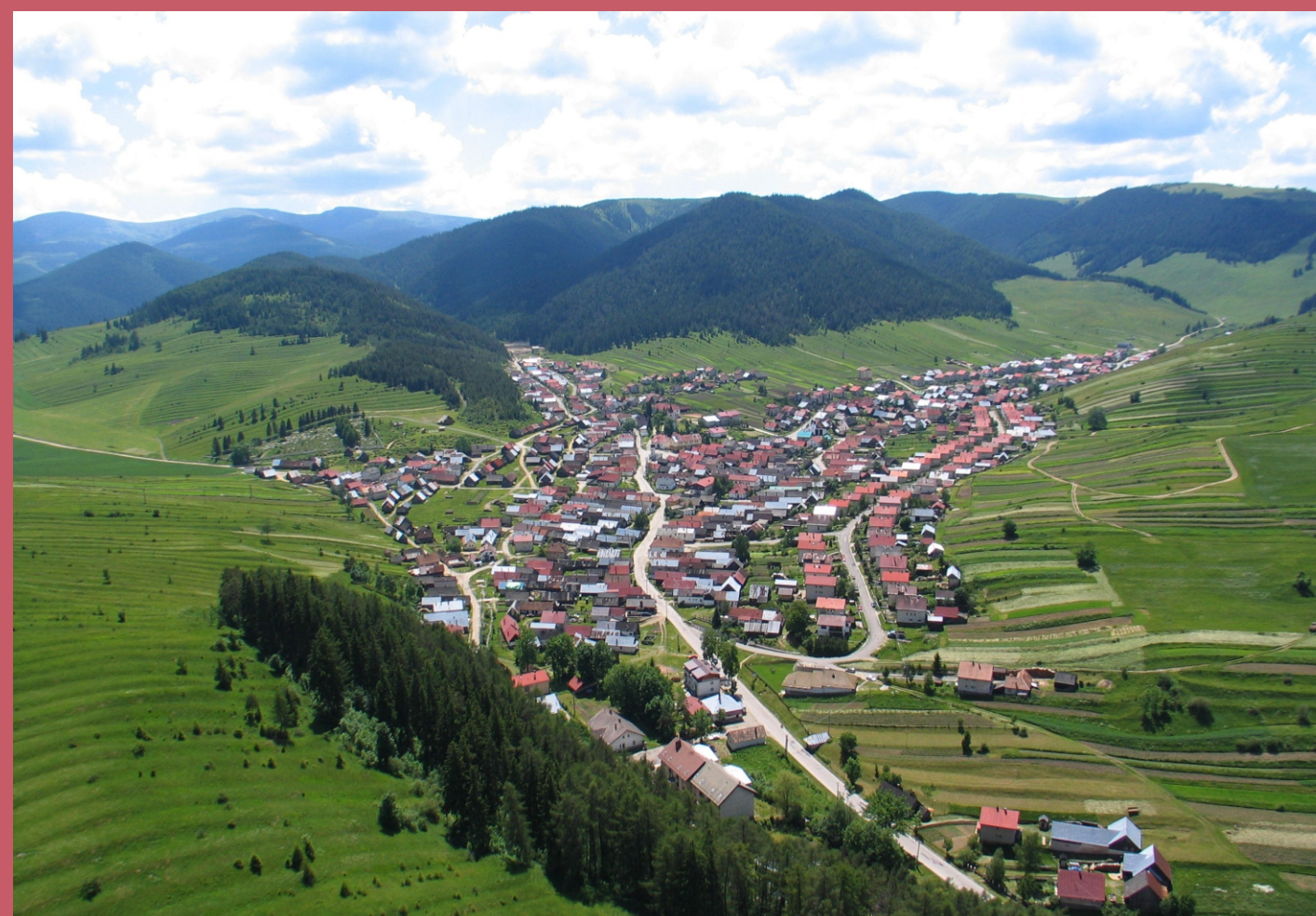
Letecký pohľad na krajinu Liptovskej Tepličky so zachovanými historickými krajinnými štruktúrami