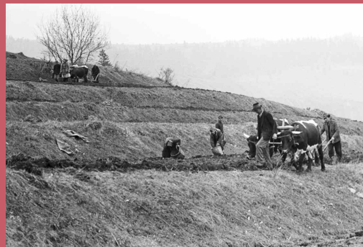
Tradičný spôsob obhospodarovania v minulosti