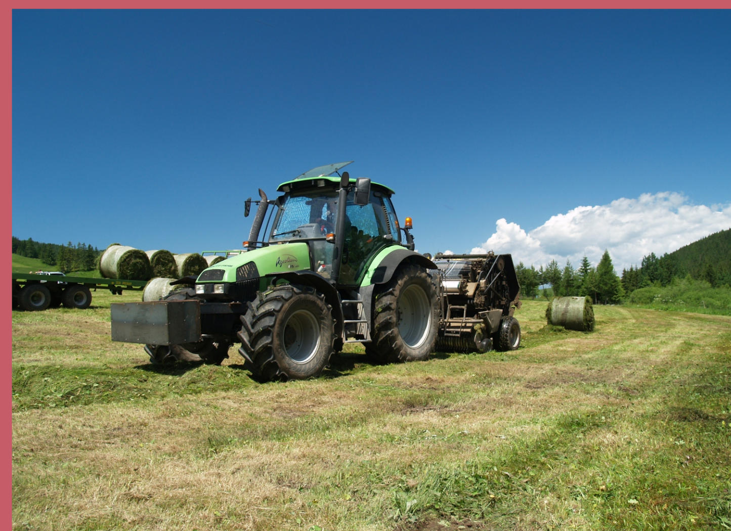
Produkcia sena modernou technikou