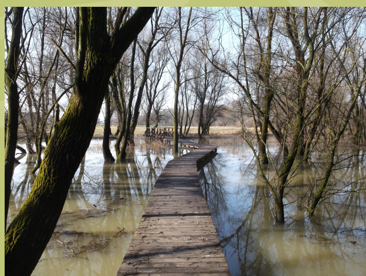
Stav po revitalizácii meandra Starého Hornádu

za pochopenie hodnoty krajiny, environmentálne prebudenie komunity a revitalizáciu krajiny prostredníctvom dobrovoľníckych aktivít